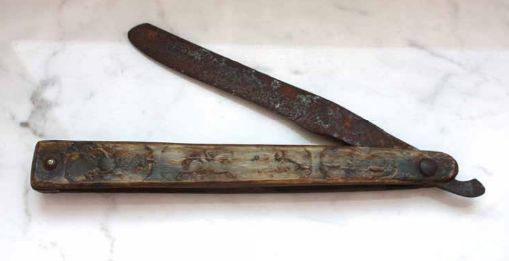
Teutenergoed uit de Teutenkamer.