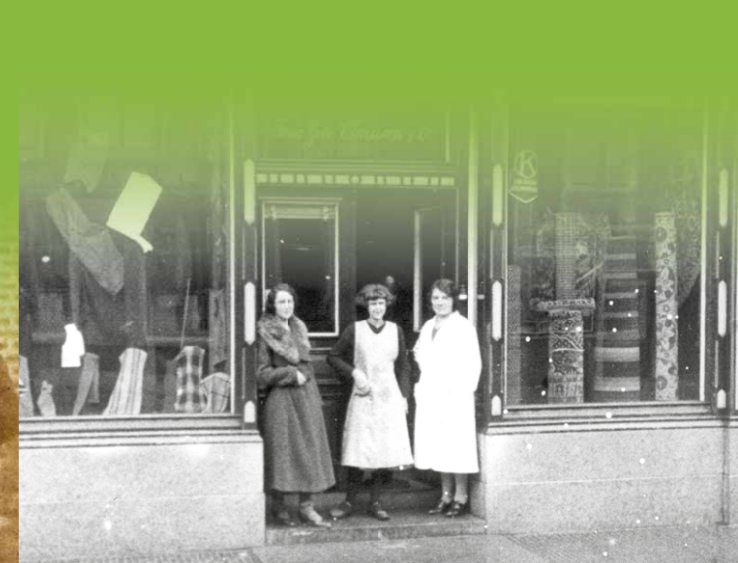
Teutenwinkel in Gouda van de Hamontse compagnie Ballings-Joosten-Spaas. De winkelfrouwen poseren.

De Teuten waren dikwijls zeer vrijgevig wanneer lokaal een school, een kerk, ... gebouwd of hersteld moest worden of een culturele vereniging opstartte.