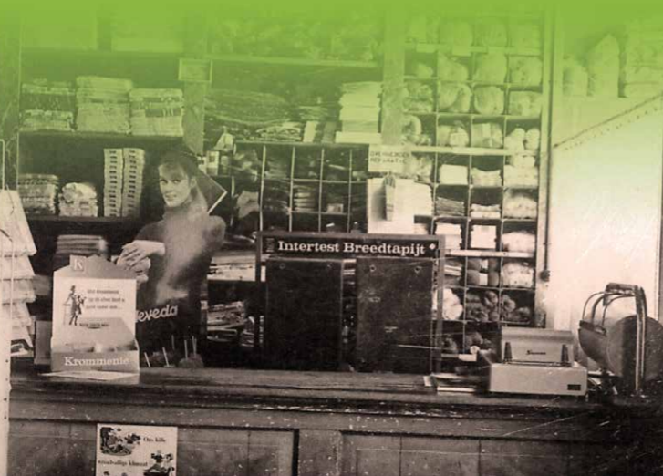
Teutenwinkel in Piershil (NL.) van de Kauliller compagnie Bierkens & Witters

De mysterieuze naam Teuten blijft tot op heden onverklaard.