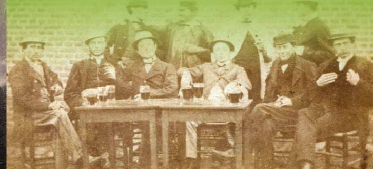
De Teuten van Kleine-Brogel (uitzonderlijk oude foto uit 1874)

In Budel waren glasteuten actief. Elders verkocht of verhuurde men uurwerken. Ook zaadgoed, vooral klaverzaad, was heel regelmatig terug te vinden in het assortiment Teutenproducten.